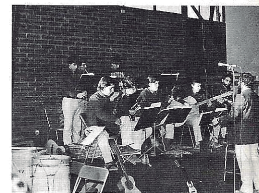
El conjunto en San José de la Mariquina

Experiencia inédita para ellos, a pesar del éxito de sus giras a Brasil, en cuanto a la cantidad de conciertos y variedad de público -"dialogamos mucho con los niños y les hicimos un programa especial, con voces e instrumentos independientes y luego