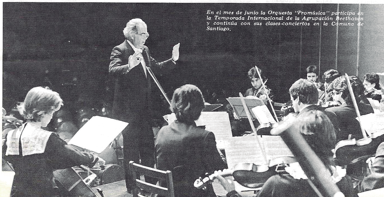
En el mes de junio la Orquesta "Promúsica" participa en la Temporada Internacional de la Agrupación Beethoven y continúa con sus clases-conciertos en la Comuna de Santiago.