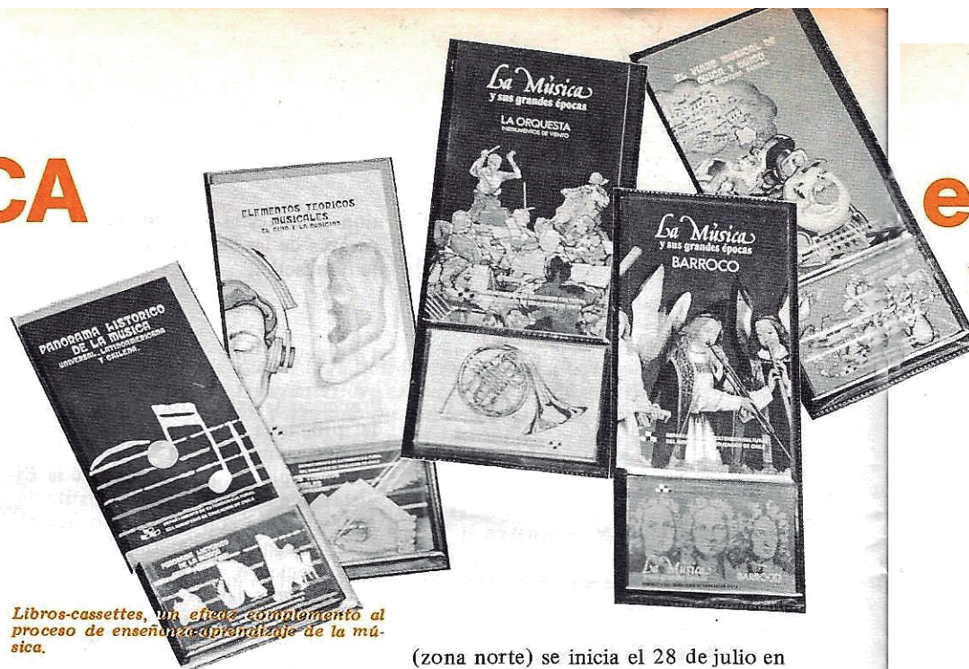
Libros-cassettes, un eficaz complemento al proceso de enseñanza-aprendizaje de la música.

La temporada de Conciertos Itinerantes, en su noveno año consecutivo,