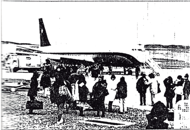
• La recepción de los músicos en la fronteriza localidad de Balmaceda.

Venían a una región desconocida para muchos y con la esperanza de ser bien acogidos, no sólo