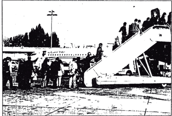
• El momento en que los jóvenes ejecutantes musicales abordan la aeronave en Santiago.

como músicos, sino también como personas.