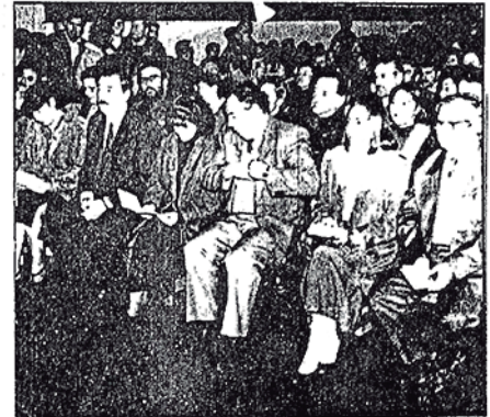
• Autoridades regionales, provinciales y comunales realzaron el concierto realizado en el Templo Catedral de Coyhaique.

• Los integrantes de la Orquesta Sinfónica Juvenil, durante la ejecución de la obra de Beethoven.