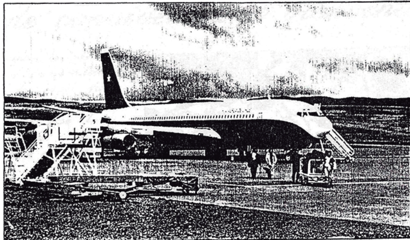
• Esto es el avión en que viajaron los integrantes de la Sinfónica Juvenil.

La Orquesta Sinfónica Juvenil, es un testimonio vivo del interés de muchos jóvenes por iniciarse en la música culta y en la ejecución de los autores más difíciles, pero que entregan ese mensaje tan universal, que sólo lo consiguen las notas musicales, para entregarnos una recreación espiritual, que fortalece más al ser humano en su inquietud por lo perfecto.